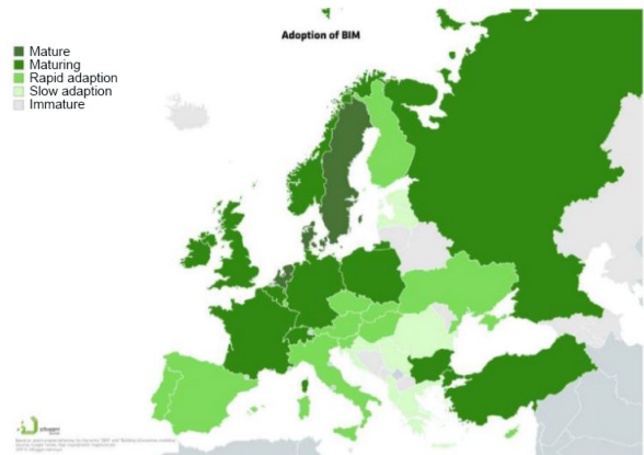
2 paveikslas. Netikslus BIM taikymas Europoje (Jacobs, 2019) Figure 2. Incorrect BIM adoption in Europe (Jacobs, 2019)

Įvardijus pasitaikančius BIM įgyvendinimo apribojimus ir iššūkius, BIM vystymas ir įgyvendinimas Lietuvos rinkoje gali būti sklandesnis. BIM įgyvendinimo procesas yra lėtinamas jo metu susidariusių apribojimų. Šie sunkumai trukdo statybų rinkos dalyviams sklandžiai įsidiesti BIM savo veikloje ir efektyvinti patį procesą. Tyrimo metu nagrinėjami dažniausiai paminėti apribojimai literatūros šaltiniuose.