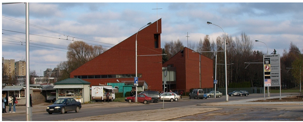
4 pav. Gerojo ganytojo bažnyčia (arch. A. Kančas, M. Preisas)

Fig. 3. The office building of the insurance company AB Lietuvos Draudimas (designed by E. Balaišienė & G. Balaišis). A view from Savanoriu Ave