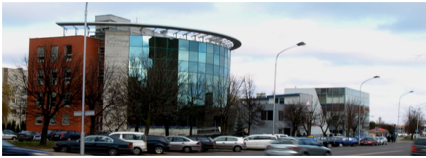
3 pav. Bendrovės „Lietuvos draudimas“ administracinio pastato (arch. E. Balaišienė, G. Balaišis) vaizdas iš Savanorių prospekto

Fig. 3. The office building of the insurance company AB Lietuvos Draudimas (designed by E. Balaišienė & G. Balaišis). A view from Savanoriu Ave