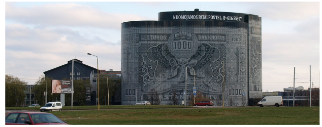
6 pav. Verslo centro „1000“ (arch. R. Adomaitis) vaizdas nuo Pramonės ir Taikos prospektų transporto eismo žiedo

Fig. 5. A refrigerator building (designed by Č. Šarakauskas). A view from Karalius Mindaugas Ave