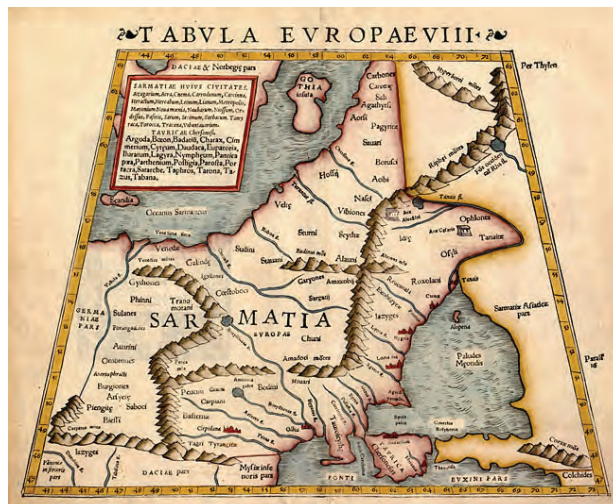
2 pav. Europos žemėlapis „Tabvla Evroepae VIII“ iš K. Ptolemajo geografijos atlaso, išleistas 1574 m. S. Münsterio

Filosofas M. Planudė buvo gerai susipažinęs su K. Ptolemajo asmenybe, labai gerbė mokslininką ir rašė iškilmingus jį garbinančius eilėraščius.