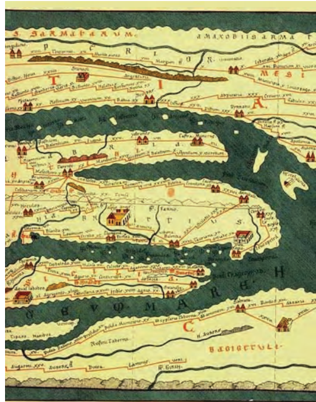
4 pav. Romos imperijos Kastorijaus kelių žemėlapis

Fig. 3. Map of the Roman Empire at it's greatest extend