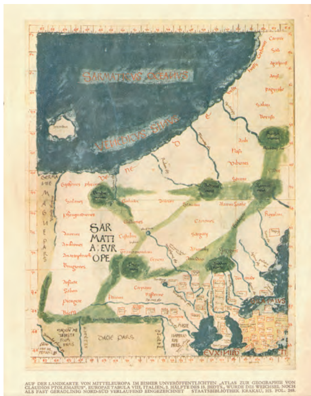
1 pav. Europos žemėlapis „Tabvla Evroepae VIII“ iš K. Ptolemajo geografijos atlaso, Fol 248

1416 m. italai pagal K. Ptolemajo „Geografijos“ duomenis tarp kitų atkūrė ir Vidurio Europos žemėlapi, kurio turinys ir kartografinis vaizdas panašus į XIII a. M. Planudės kopijos turinį. „Geografija“ ir žemėlapiai pirmą kartą atspausdinti Bolonijoje (Italija) 1477 m.