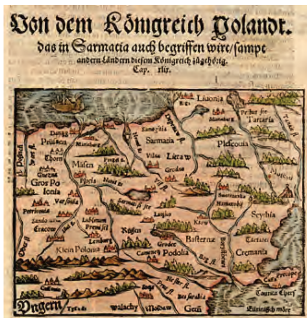
5 pav. S. Münsterio Vidurio Europos žemėlapis, 1578 m. Fig. 5. Map of Middle Europe by S. Munster, 1578