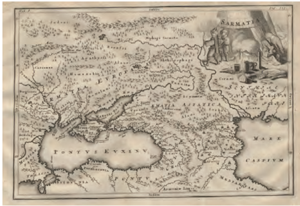
7 pav. Ch. Kelerio Europinės Sarmatijos ir Azijinės Sarmatijos žemėlapis, 1705 m.