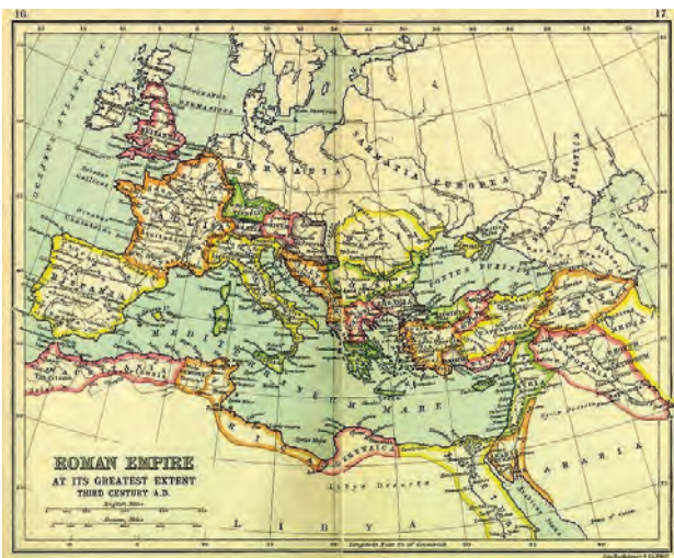
3 pav. Romos imperijos žemėlapis didžiausio jos teritorijos išsiplėtimo laikotarpiu

Sarmatijos egzistavimą patvirtina ir III a. Romos imperijos Kastorijaus kelių žemėlapis, žinomas kaip Peutingerio lentelės, kuriame už Romos imperijos ribų pažymėta Sarmatija (4 pav.).